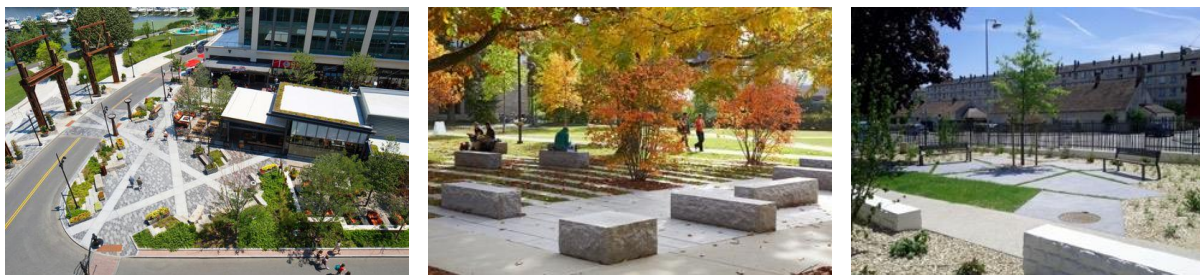
Équilibre végétal / minéral, mise en place de mobilier sur les parvis