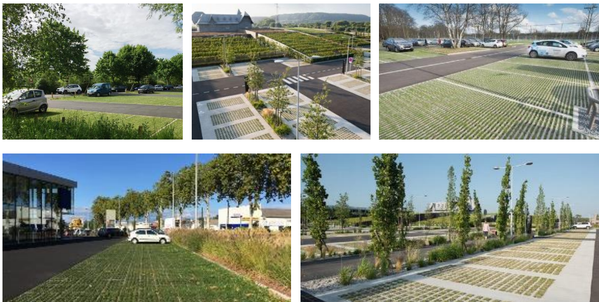
Exemple de stationnements en revêtements perméables / drainants (dalles gazon ou pavés joints verts)