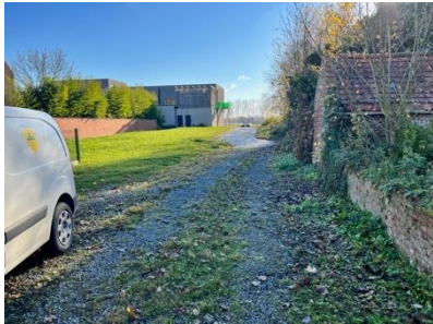
Accès depuis la rue Jules Ferry (RD8)

Il est précisé que des sondes géothermiques, destinées au chauffage de l'extension de l'école, sont implantées sous la parcelle 1196.