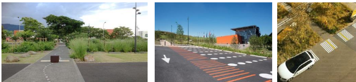
Exemple de cheminements piétons dédiés et signalétique originale au sol

NB : la place la plus éloignée du parking est située à 100 m de l'entrée de l'école Lanoy et 150 m de l'école Ferry.