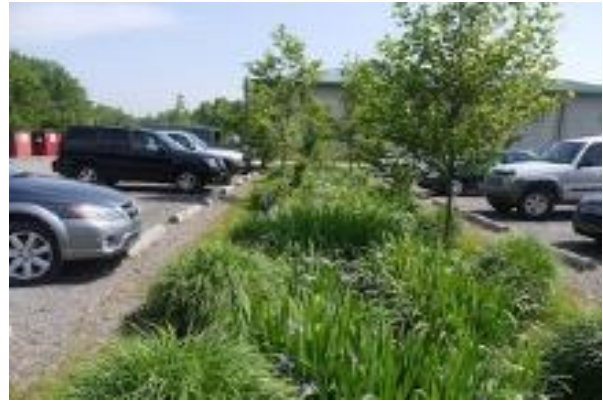
Exemple de noues pour gestion des eaux pluviales