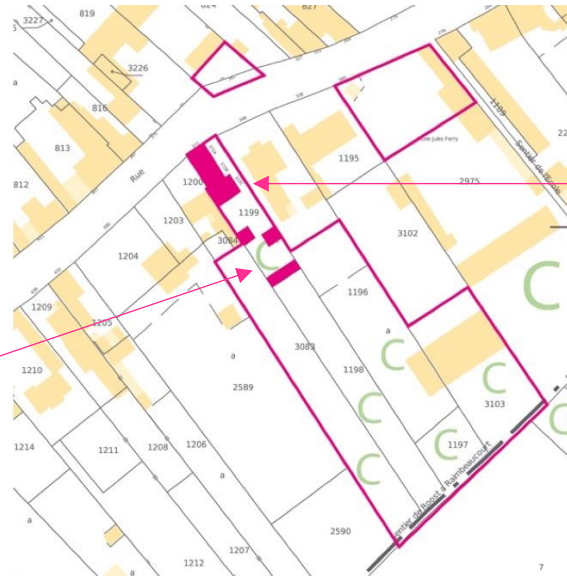
Démolition bâtiments sur parcelle B 1199