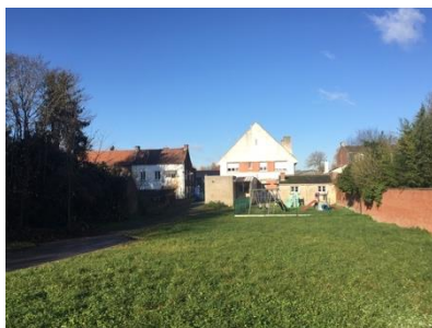
Vue sur l'arrière de l'ancienne Poste