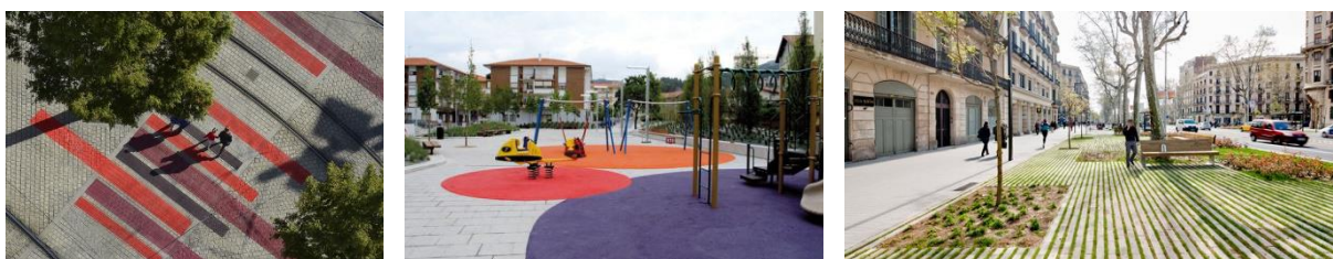
Traitement de sol coloré et utilisation de matériaux qualitatifs.

Le choix des matériaux a fait l'objet d'une attention particulière. En effet, il participe à l'intégration et à la qualité des espaces aménagés. Les parvis seront traités en pavés béton et ponctués de zones plus colorées afin d'animer cet espace d'entrée d'école.