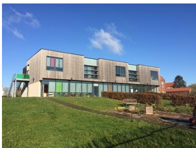
L'extension de l'école Ferry