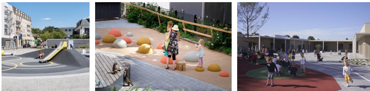
Mise en place de jeux ludiques et travail sur les formes pour organiser des espaces ludiques, calme, d'attente sur les parvis

Le choix des matériaux a fait l'objet d'une attention particulière. En effet, il participe à l'intégration et à la qualité des espaces aménagés. Les parvis seront traités en pavés béton et ponctués de zones plus colorées afin d'animer cet espace d'entrée d'école.