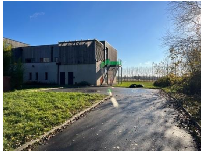
En fond de parcelle, l'extension de l'école Ferry, vue sur les champs et le paysage rural