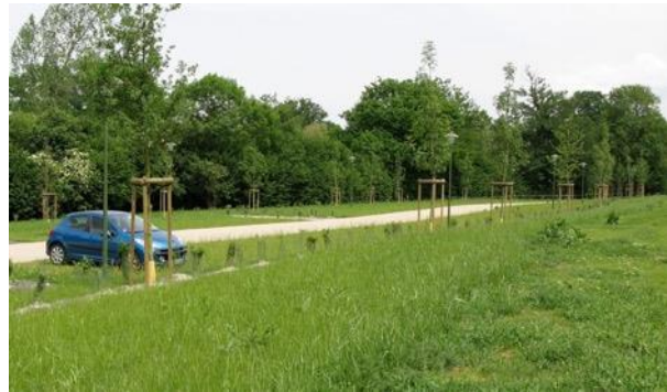
Gérer de manière différenciée les espaces pour favoriser la biodiversité et limiter les coûts d'entretien