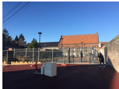
Enrobés rouge et imperméabilisation de l'espace public