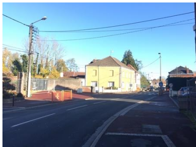
Le parvis de l'école Lanoy depuis la RD

L'accès à l'école Lanoy vient de faire l'objet d'un aménagement avec mise en place d'une nouvelle clôture et végétalisation des abords direct de l'école. Le parvis n'a pas été traité, un enrobé été appliqué dans l'attente d'un projet d'ensemble.