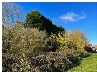
Végétation dense au Sud-Ouest du site

Sur la parcelle B 1199, il existe des bâtiments qui seront démolis dans le cadre du projet.